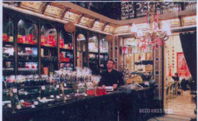
DECO IDEES 133