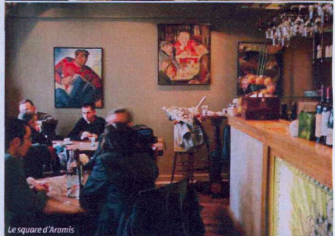
Le square d'Aramis