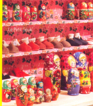
Le Petit Souk