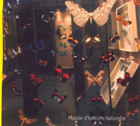
Musée d'histoire naturelle